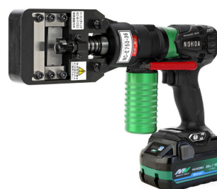
充電式ポンプとセット例