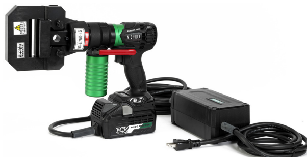
ACアダプタとセット例