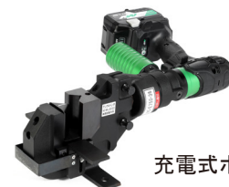
充電式ポンプとセット例