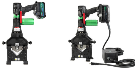
充電式ポンプとセット例

環境対策が必要な食品、医療、化学、学校関係の工事現場に最適。 時間制限がある原子力発電所内管理区域での廃材切断にも実績あり。