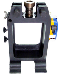
↑ 切断刃物と 全オプション類を外した 本体フレーム (NC-M-HC-1-H)