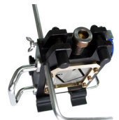
↑ スケールロッド (全長約1.5m)