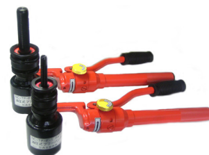
油圧フリーパンチとセット例