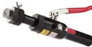
横切刃物セット例