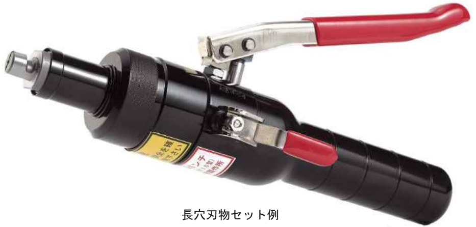
長穴刃物セット例