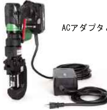
ACアダプタとセット例