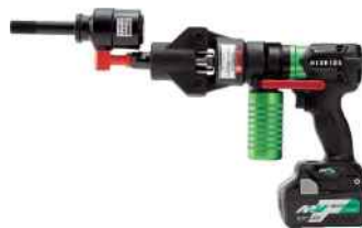
充電式ポンプとセット例