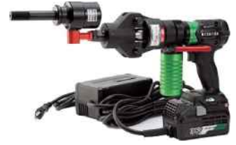
ACアダプタとセット例

手動式と比較して格段にパワーが大きいため、小軸が破損する恐れがあり、危険ですので小軸用刃物は使用しないでください。付属のFP大軸はF大軸と同寸法ですが、事故防止のため、あえて小軸穴は空けていません。従来のF大軸をセットして小軸刃物を使用することも、危険ですのでお止めください。セットボルト3/8も同様に使用しないでください。