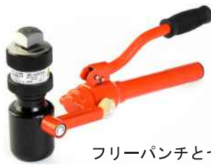
フリーパンチとセット例

スピーディーに追い切り加工が可能！ 切粉の飛散（ヤスリ、ジグソー）がなく、 仕上り品質は良好。二次加工不要。 配電盤加工、電気工事から工場ライン、 試作品製作まで、幅広くお役に立てます。