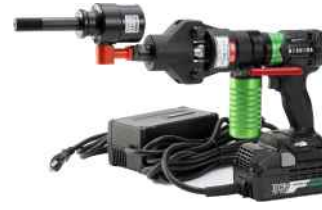
ACアダプタとセット例

手動式と比較して格段にパワーが大きいため、小軸が破損する恐れがあり、危険ですので小軸用刃物は使用しないでください。付属のFP大軸はF大軸と同寸法ですが、事故防止のため、あえて小軸穴は空けていません。従来のF大軸をセットして小軸刃物を使用することも危険ですのでお止めください。セットボルト3/8も同様に使用しないでください。