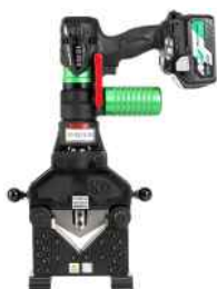
充電式ポンプとセット例

環境対策が必要な食品、医療、化学業界などの工事現場に最適。 原子力発電所の管理区域内での廃材切断にも納入実績あり さまざまな環境対策に応用できます