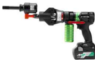
充電式ポンプとセット例