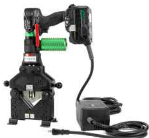
ACアダプタとセット例