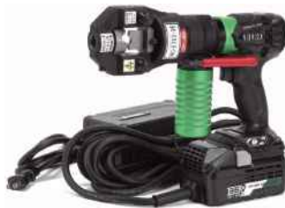
リリウム (36V) AC アダプタ仕様とセット例

ご注意：ミリネジのステンレス材の場合、材質によって切断後スムーズにナットが入らない場合もあります。