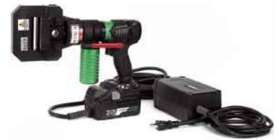
ACアダプタとセット例