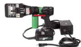
充電式ポンプ (リリウム) とセット例