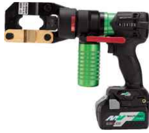
リリウム (36V) とセット例