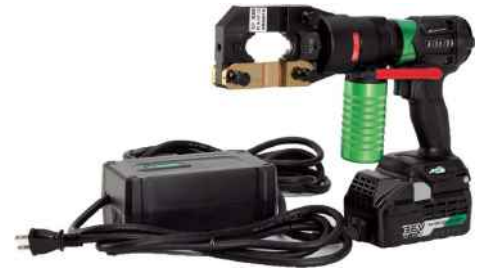
リリウム (36V) ACアダプタ仕様とセット例