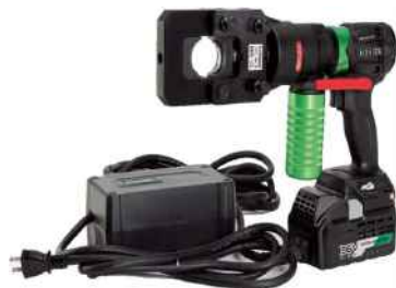
リリウム (36V) ACアダプタ仕様とセット例