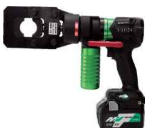
リリウム (36V) とセット例