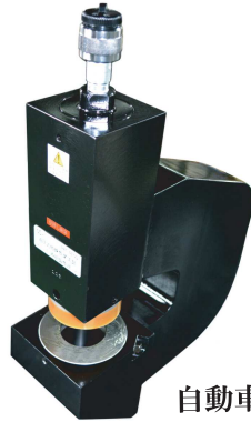
自動車メーカーT社 多数納入実績あり NC-KSP50