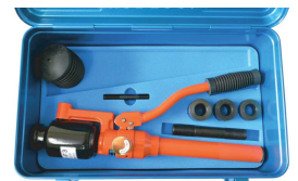
フリーパンチ本体 型番 NC-TP-F3-HN (刃物なし)