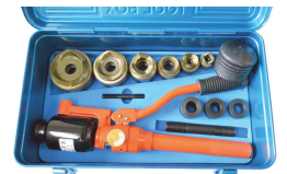
薄鋼電線管 CPセット 型番 NC-TP-F3-CP 厚鋼電線管 ACPセット 型番 NC-TP-F3-ACP