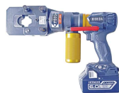
アウクシーとセット例