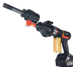
アウクシーとセット例

手動式と比較して格段にパワーが大きいため、小軸が破損する恐れがあり、危険ですので小軸用刃物は使用しないでください。付属のFP大軸はF大軸と同寸法ですが、事故防止のため、あえて小軸穴は空けていません。従来F大軸をセットして小軸刃物を使用することも危険ですのでお止めください。セットボルト3/8も同様に使用しないでください。