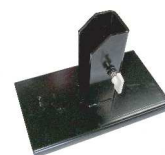
定置作業用スタンド (別売) 定価 ¥15,300