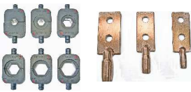
M-T240 六角圧縮用別売ダイス (各1組2個付)