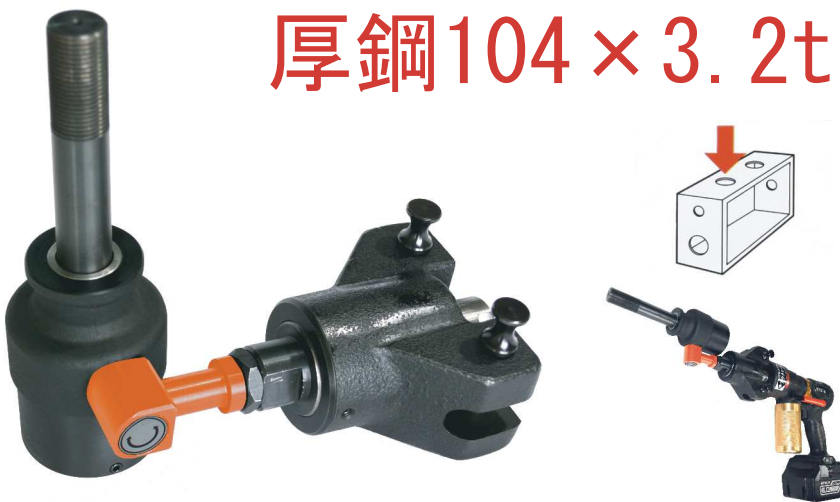
アウクシーとセット例

手動式と比較して格段にパワーが大きいため、小軸が破損する恐れがあり、危険ですので小軸用刃物は使用しないでください。付属のFP大軸はF大軸と同寸法ですが、事故防止のため、あえて小軸穴は空けていません。従来のF大軸をセットして小軸刃物を使用することも危険ですのでお止めください。セットボルト3/8も同様に使用しないでください。