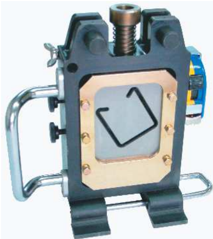
写真はオプションの取手、スタンド付