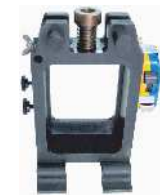
↑切断刃物と、全オプション類を外した本体 (NC-M-HC-1-H)