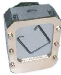
↑各型番に切断刃物1点付属

刃物割れの少ない丈夫な刃物はステンレス材の切断に違いが判ります。刃物取替えも簡単になりました。スケールは標準付属。