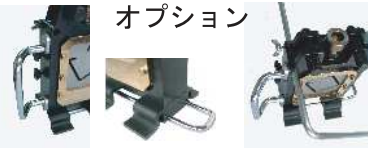
取手↑ スタンド↑ スケールロッド↑