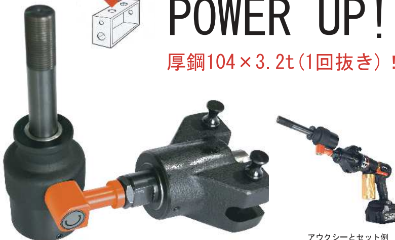
アークシーとセット例

手動式と比較して格段にパワーが大きいため、小軸が破損する恐れがあり、危険ですので小軸用刃物は使用しないでください。付属のFP大軸はF大軸と同寸法ですが、事故防止のため、あえて小軸穴は空けていません。従来のF大軸をセットして小軸刃物を使用することも危険ですのでお止めください。セットボルト3/8も同様に使用しないでください。