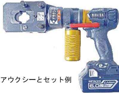
アークシーとセット例